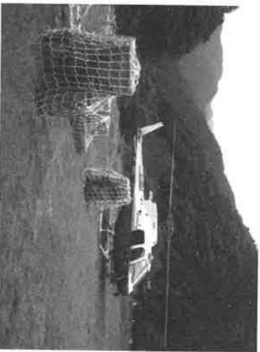
神の川ヒュッテよりへり発着 昨年の荷揚げの様子